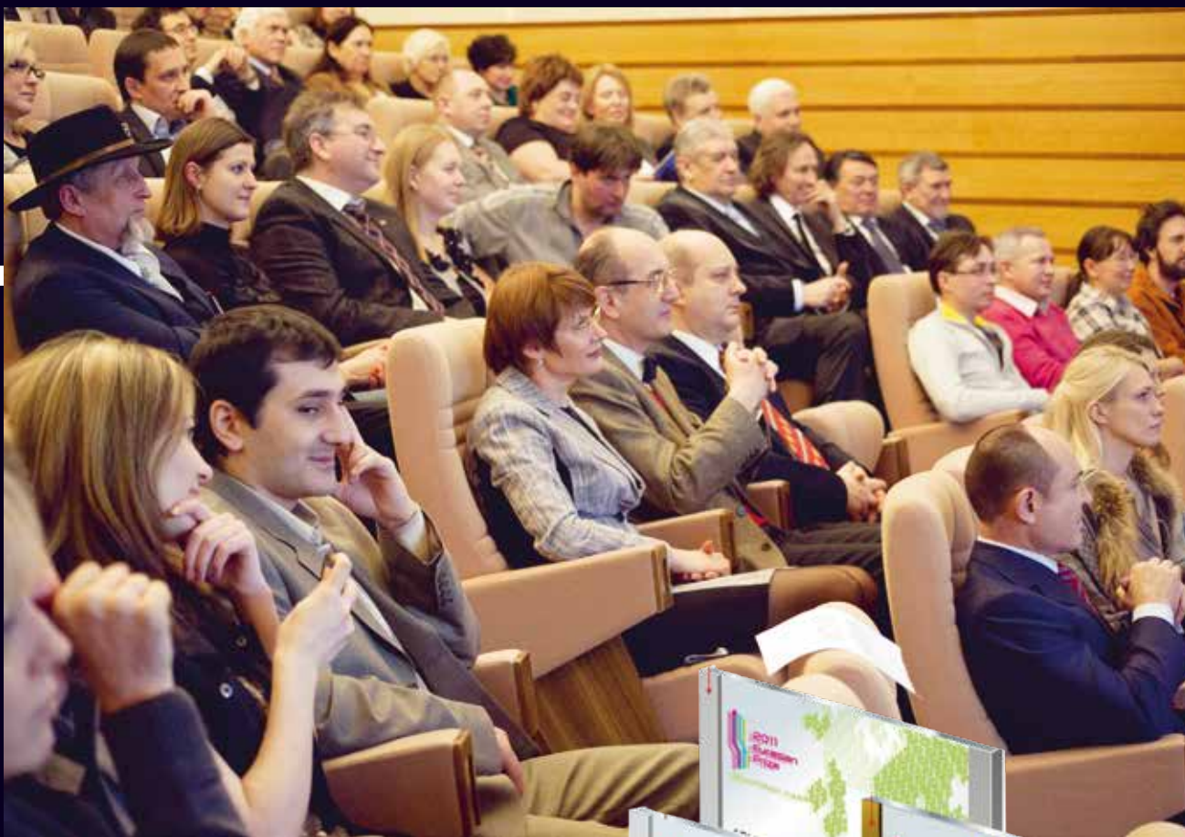
Гости церемонии награждения в резиденции губернатора Свердловской области