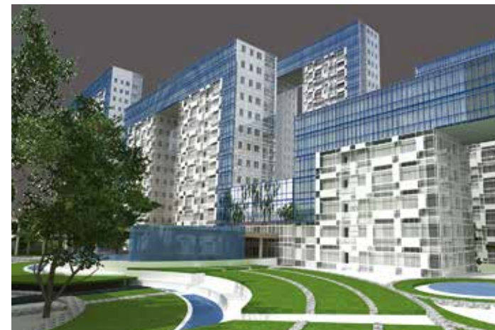
МНОГОФУНКЦИОНАЛЬНЫЙ ЖИЛОЙ КОМПЛЕКС В ПЕРМИ Студенческий конкурс, золотой диплом в номинации «Архитектура жилых зданий»