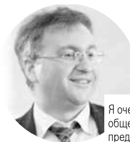
Маркус Форстер Консул Генерального консульства Германии в Екатеринбурге:

Я очень рад, что в этом году премия фестиваля в категории «Архитектура общественных зданий и сооружений» досталась архитектору из Германии, представляющему студию «fb-agch», г. Штутгарт. На конкурсе было представлено очень много динамичных, инновационных проектов, особенно креативными мне показались студенческие работы. Здорово, что молодое поколение умеет мечтать! Я надеюсь, что связи в области архитектуры и дизайна между Германией и Россией будут укрепляться и это сотрудничество принесет еще немало успешных плодов.