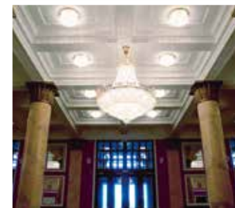
САМАРСКИЙ АКАДЕМИЧЕСКИЙ ТЕАТР ОПЕРЫ И БАЛЕТА Профессиональный конкурс, серебряный диплом в номинации «Градостроительство»